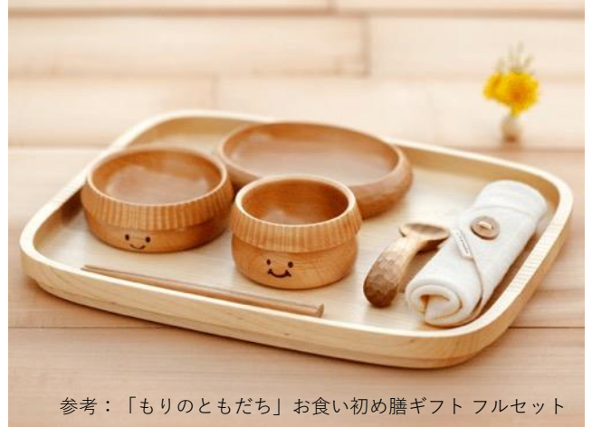
参考：「もりのともだち」お食い初め膳ギフトフルセット

出店期間 | 6月26日（水）～7月2日（火） 営業時間 | 11:00～19:00*初日のみ12時オープン ※コバル計画での離乳食の販売は17時までになります。