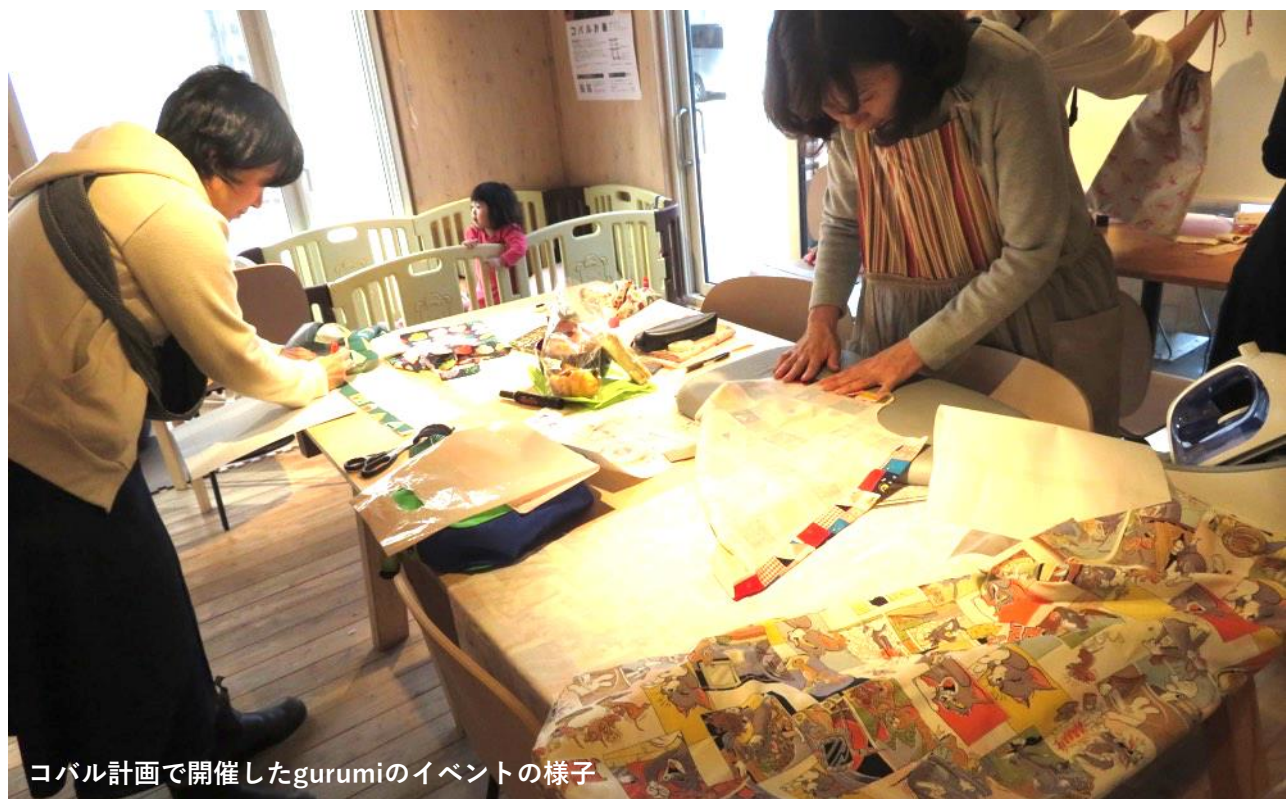
コバル計画で開催したgurumiのイベントの様子